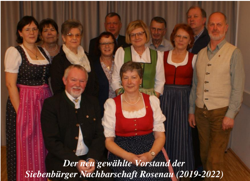
Der neu gewählte Vorstand der Siebenbürger Nachbarschaft Rosenau (2019-2022)