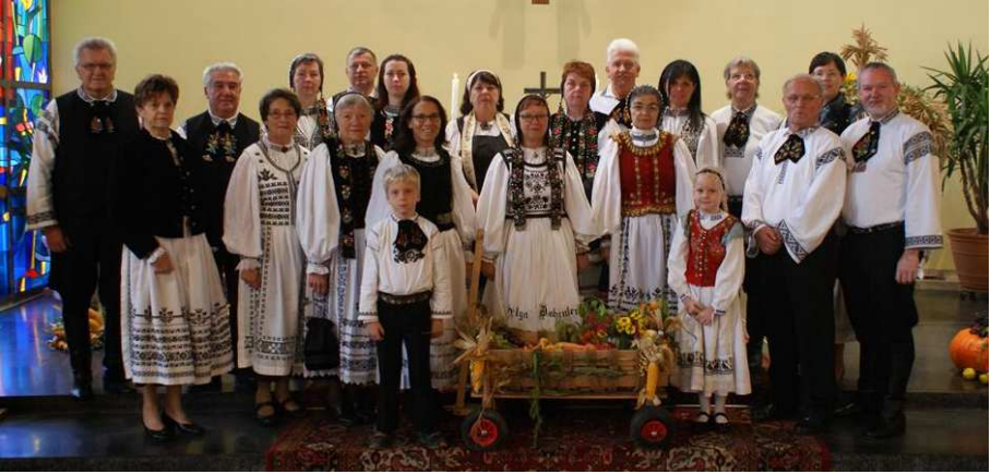
Auch in diesem Jahr waren wir wieder mit einer großen Gruppe von Siebenbürger Trachtenträgern beim Erntedank-Festgottesdienst dabei