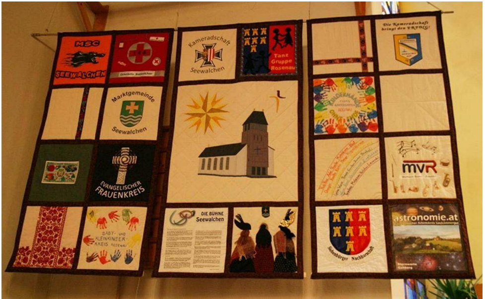
Ein Symbol der Gemeinschaft: Der Wandbehang an dem sich viele Seewalchner Vereine beteiligt haben und auf dem noch Platz ist...